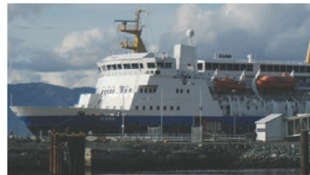
Gann har tidligere vært hurtigrute og fungerer store deler av året som skoleskip.

KUNNSKAP FRA GENERASJON TIL GENERASJON OG HENGIVENHET FOR TRE!